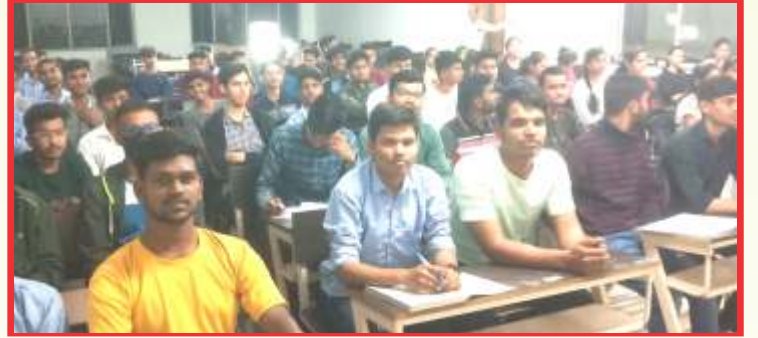
नेतृत्व, उत्साह, आत्मविश्वास