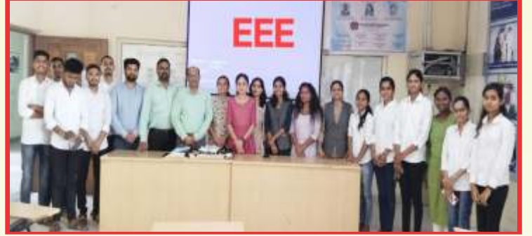
सेमीनारला भगवच्च उपस्थिती