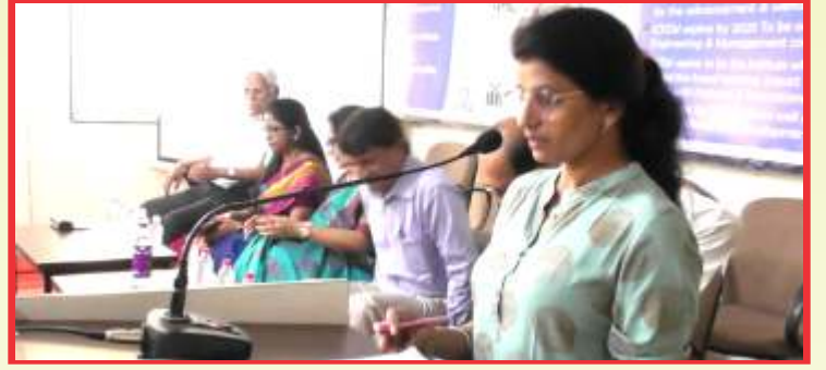
अंतराळ शास्त्रज्ञ यांची आयसीएम कॉलेजला भेट