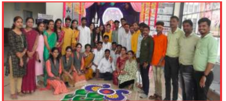
गणेश जयंती.. विद्यार्थ्यांचा उत्साह