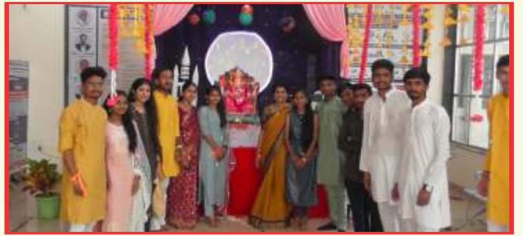
सांस्कृतिक कार्यक्रमात सहभाग