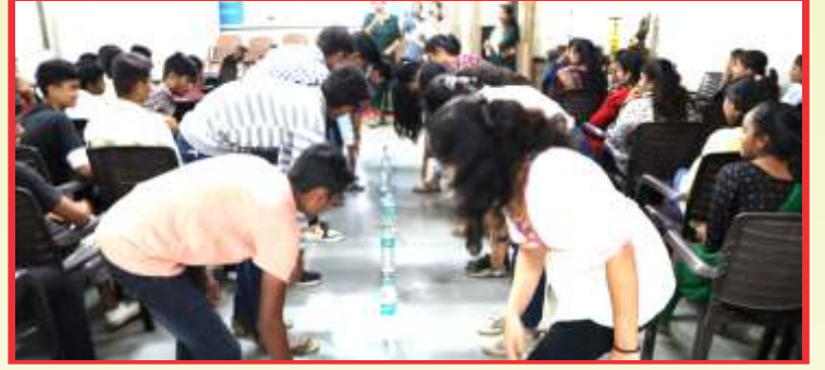
खेळात दंगलेले विद्यार्थी