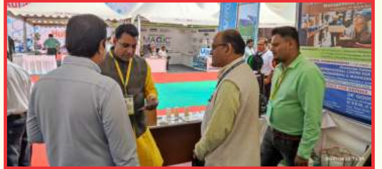
महा एक्सपो मधील आयसीएम स्टॉलला प्रेक्षकांची भेट