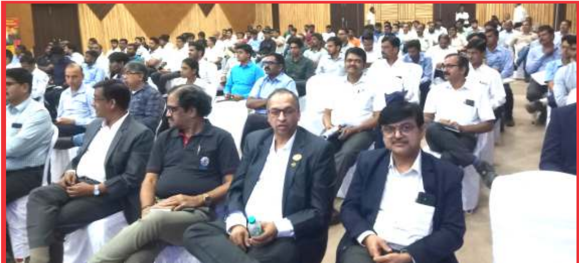
नवे पाऊल, नवा संपर्क, नवा मार्ग