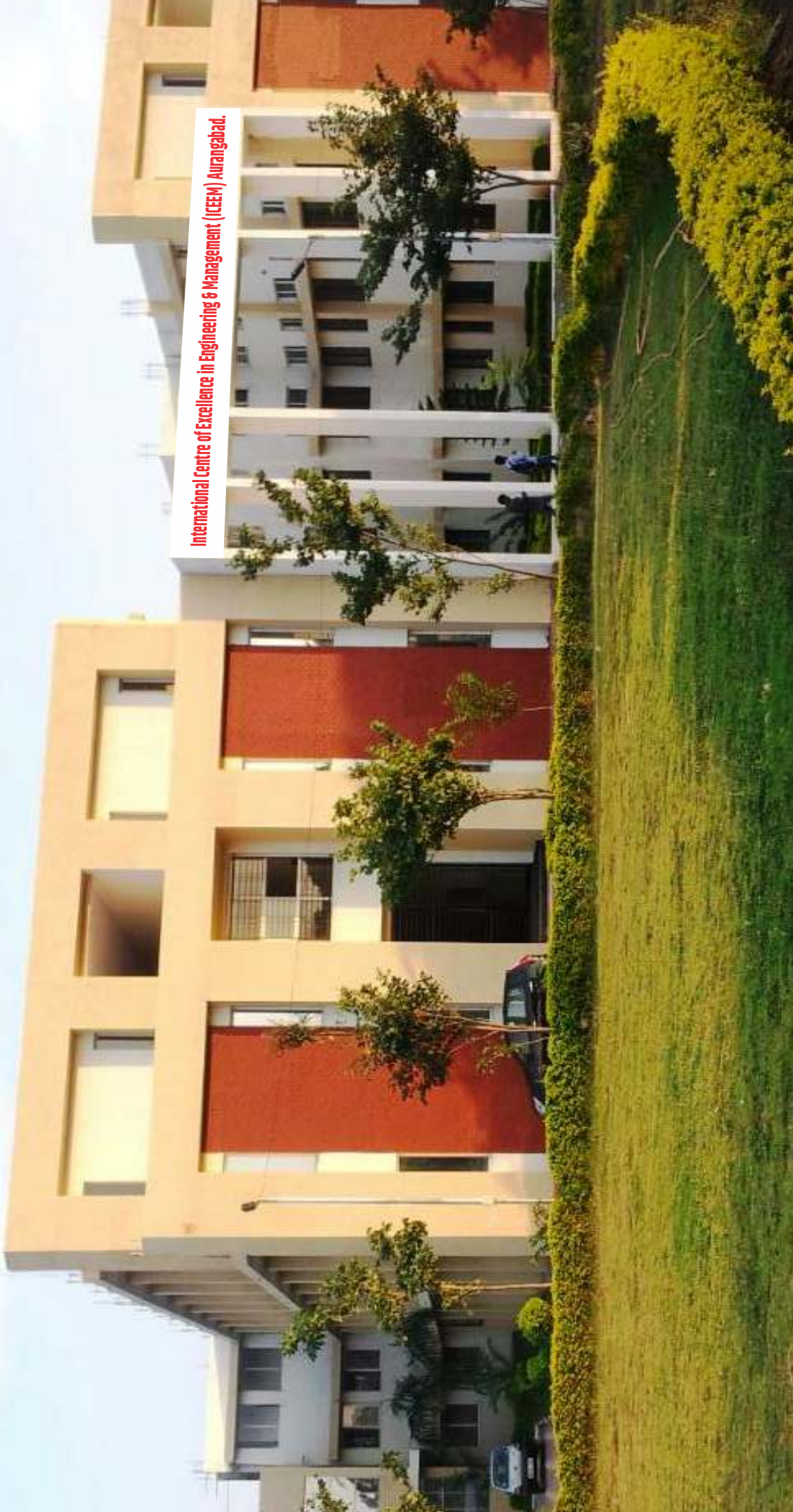
International Centre of Excellence in Engineering & Management (ICEEM) Aurangabad.

Waluj, Opp. Bajaj Auto Ltd., Pune Highway, Chh. Sambhajinagar (Aurangabad) Maharashtra Approved by A.I.C.T.E. - New Delhi, Recognized by D.T.E., Govt. of Maharashtra, NAAC Accredited & Affiliated to Dr. B.A.M. University, Aurangabad M:- 7249 00777 / 7020 475138 | Ph: 0240 2558 106/103 | web: www.iceemabad.com | Email: director@iceemabad.com